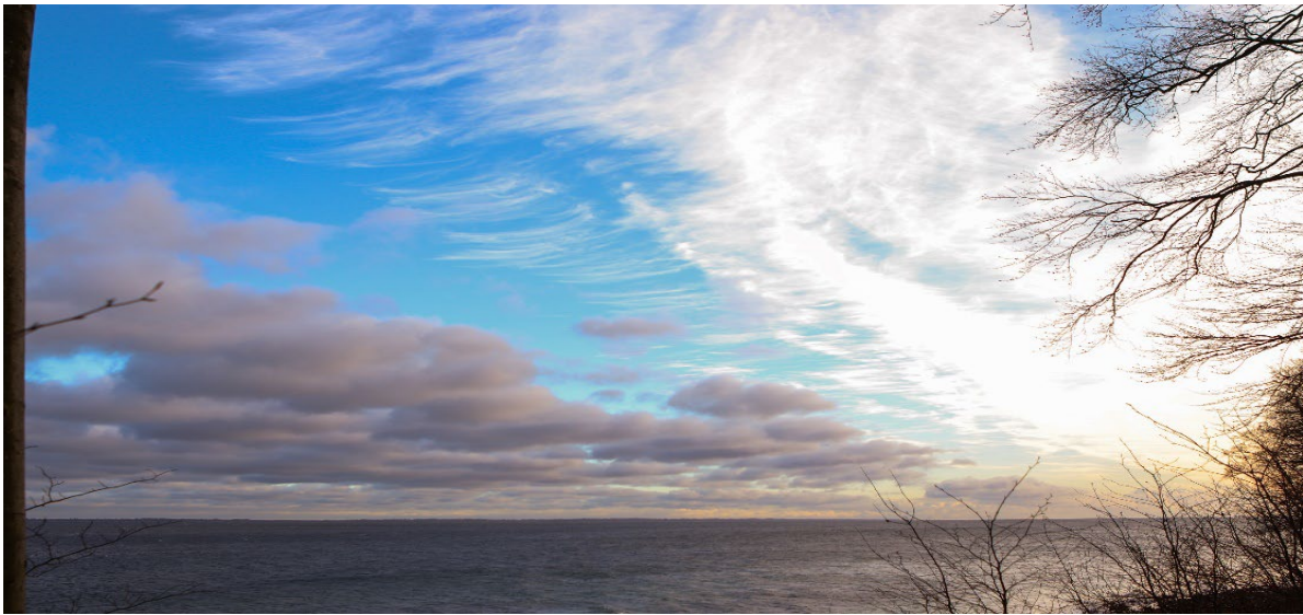
En dag ved Blommeskobbel hvor lys og mørke mødes