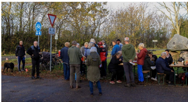
En del fremmødte ved vores indvielse af stenskulpturen

På generalforsamlingen d. 12.05.2022 drøftede forsamlingen idé-udvikling til laugets fremtidige arbejde. De idéer og spørgsmål, som kom frem, har bestyrelsen arbejdet videre med, og har opdelt dem i 17 punkter – og er fremkommet med følgende kommentarer.