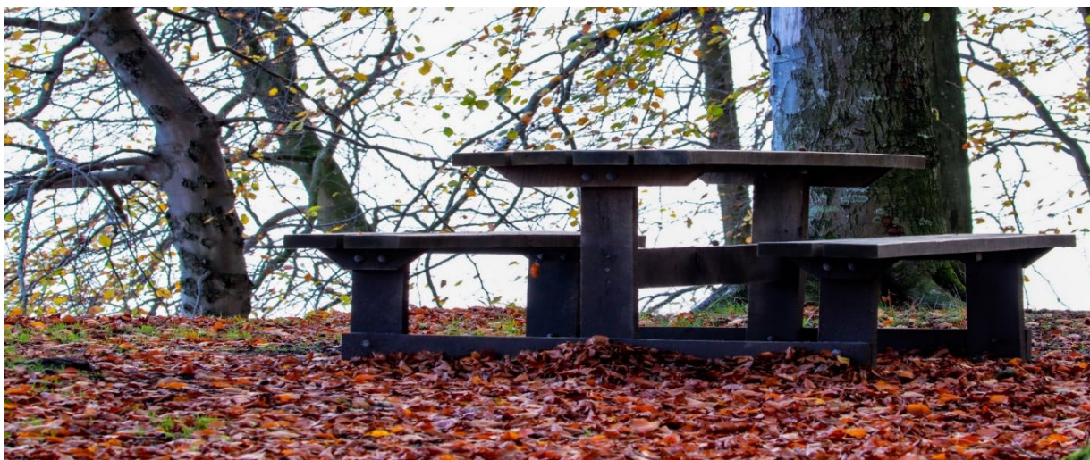
Bænk i Blommeskobbøl, hvor den medbragte mad kan nydes, med udsigt over Lillebælt.